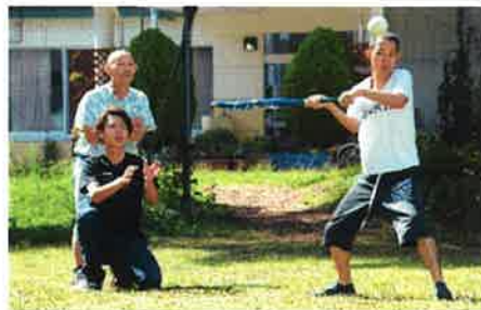
外で元気にソフトボール!