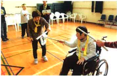
体を動かしてリフレッシュ!

利用者さんが自分で好きな活動を選択し、楽しく参加している様子を見ると職員もうれしく思います。利用者さんの笑顔あふれる素敵な表情を、皆さんにもご紹介します!