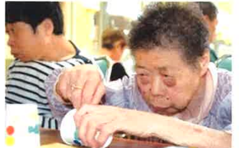
季節に合わせた工作も!